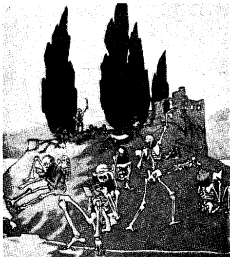
Hur en tecknare föreställer sig Italien efter ett århundrade av fascistisk diktatur.

Enligt arbetets Magna Charta har fackförening plikt att tillvarata arbetarnas intressen, men den har också rätt att pålägga dem offer. Och denna "rätt" är den fascistiska fackorganisationens väsentliga