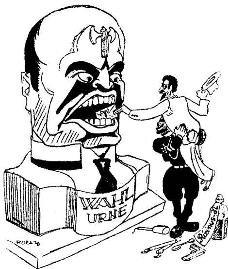
Välj mig, eljest stukar jag dig.

När detta är gjort sammanträder det fascistiska partiets stora råd, gallrar ut och uppsätter till kandidater de personer, som